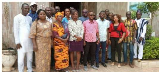
Photo de famille des participants à l'atelier