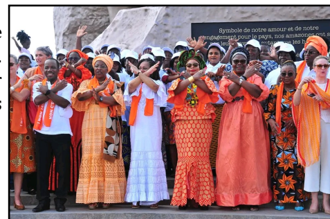
© Lancement des 16 jours d'activisme contre les VBG aux pieds de la statue de l'Amazone

Les 16 Jours d'activisme contre la violence basée sur le genre en appellent à la justice. Cette campagne interpelle dans le monde entier les autorités judiciaires, pour protéger les victimes et sanctionner les crimes.