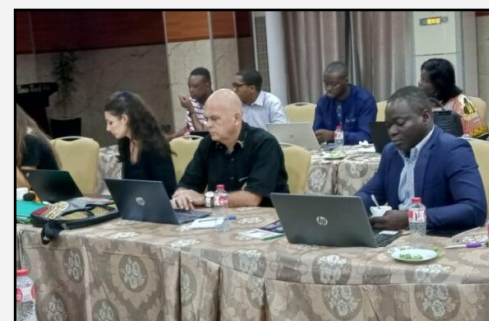
Vue partielle des participants

La séance a également été suivie par la DGD—Direction Générale du Développement belge, - depuis Bruxelles par visioconférence.