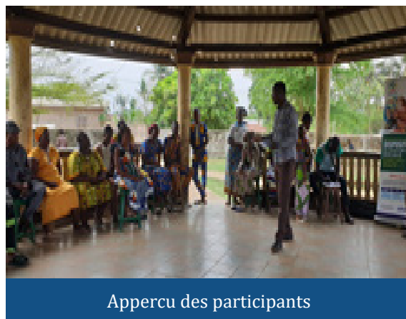
Appercu des participants

Descendre sur le terrain pour rassurer les partenaires de la proximité et aussi pour permettre aux membres du COS constater de visu le déroulement de quelques activités, tel est le leitmotiv qui justifie la mission qui a eu lieu du 6 au 8 mars 2023, en prélude à la première réunion proprement dite du COS de l'année 2023.